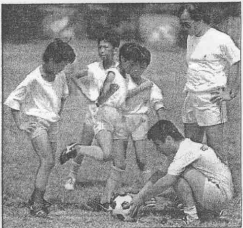
↑ 如何運用腳部，大哥哥教正小弟弟。 ↓ 老國腳鐘劍武示範胸部控球。

【本報訊】為做好足運往下紮根工作，全國足協結合南僑、賓漢、佳格等熱心廠商，投下近三百萬元的活動經費，七月開始在全省各地展開「足球夏令營」活動。 足協策畫多時的足球基層訓練，準備在這兩個月於全省各縣市召訓三千名以上的學員，第一站一日已於嘉義東石國中開訓，今(六)日即將結訓，昨(五)日台北縣訓練站在光興國小開課，每六天為一單元，以一百名學員為基準。 昨天開訓的台北縣一站，有修德、清水、自強國小及光榮國中足球隊的一百零二名學員參加，由老國腳鐘劍武帶領親自主持訓練。在彭武松及洪劉進兩位助教協助下，展開了第一天最基本的足球控球、各種踢法及傳球等訓練。 目前足球協會已排出的有十二個縣市的十五期訓練營，有一千六百名以上的參與學員，對象主要是各國中及國小的學生，十日起，同時又有花蓮、高縣及南縣三站登場。