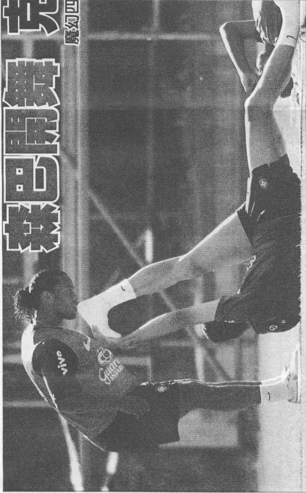
▲巴西隊今天將首戰克羅埃西亞，陣中大將羅納丁紐（左）與隊友盧西歐訓練球前相互拉筋。