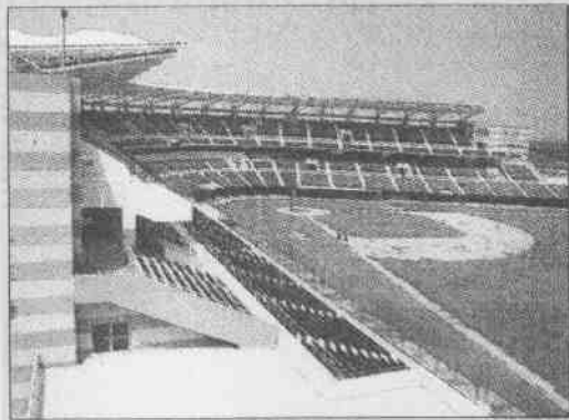
↑雲林斗六棒球場主體工程斥資八億元興建，加上二億元場外公共設施及景觀綠美化費用，總計花費十億元，是全台最具規模及符合國際標準的全新棒球場。