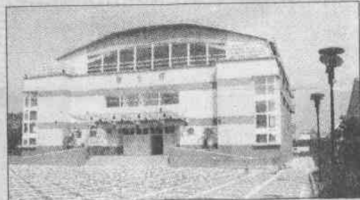
↑坐落於斗南文安國小的健美館，耗資477萬元興建，健美館是94全運最後興建完成的比賽場館，象徵雲林縣籌備工作已完全就緒。