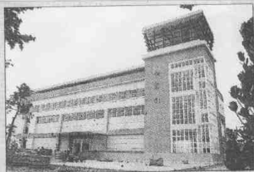
↑位於林內國中的武術館，是全運會四個新建場館之一，斥資4035萬元興建，樓地板面積1946平方公尺，地上三層樓高20.45公尺。