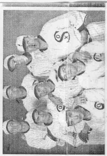
一九一九年世界大賽發生「黑襪事件」，八名白襪隊員涉打放水球，被終身禁賽，還曾改編成好萊塢電影。

←前時報鷹隊「棒球王子」廖敏雄歸於平淡擔任高中教練，卻仍被教育部列入代黑名單，他無奈地說：「我已經付出代價。」