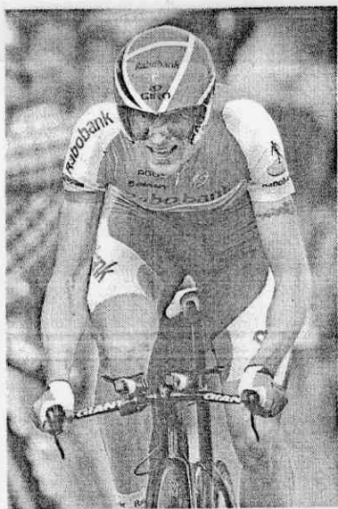
■台灣捷安特贊助的荷蘭銀行隊是去年環法總車隊第三。