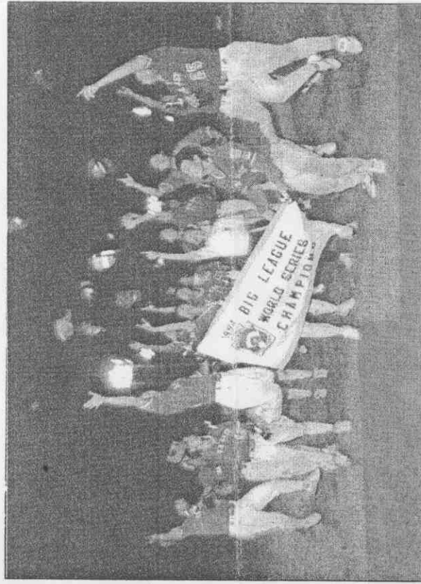
中華隊勇奪世界青棒冠軍，在球場上拋帽慶祝。