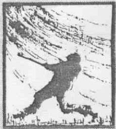
第3屆會長杯 棒球錦標賽