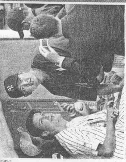
台灣之光王建民(中)成績越來越好，外國球迷也越來越多，昨天練習後，小球迷紛紛要求合影留念。