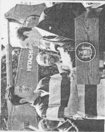
紐約州長史皮哲(右)昨天在大都會北方鐵路「洋基站」動土典禮，特別介紹王建民(左)是偉大的投手，並與他握手致意。

洋基站的基礎建設經費約六千餘萬美元，配合附近橋外道路及橋樑工程，總經費約九千一百萬美元。