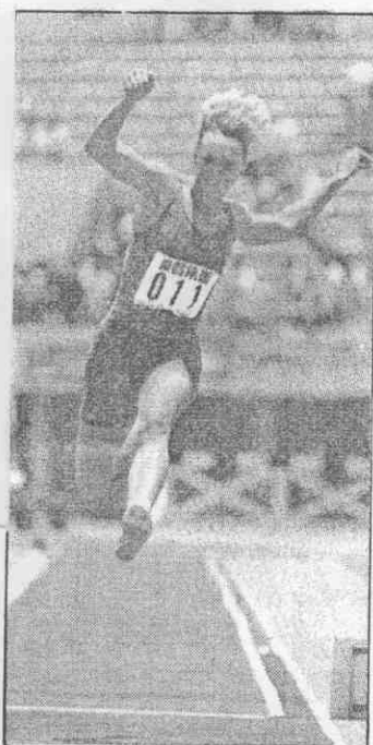
↑德瑞絲勒第一次參加三級跳遠比賽，觀眾大飽眼福。