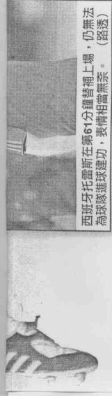
西班牙托雷斯在61分鐘替補上場，仍無法為球隊進球建功，表情相當無奈。