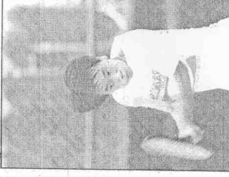
▲華裔網球選手張德培，成為美國的「明日之星」。(張福順攝)

●中華男、女跆拳道隊，今年十月七日至十一日，在華裔網球選手張德培，成為美國的「明日之星」。(張福順攝)