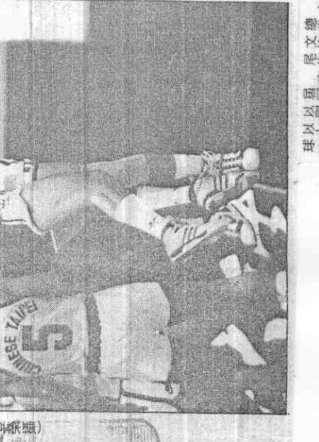
▲陳志忠在洛杉磯公開賽中奪冠。

●美國的高爾夫一向被譽為高爾夫之在耳，世界各國好手莫不以在美國奪冠為目標，終於在二九八七年二月，第一位亞洲選手在美國本土贏得冠軍——他是陳志忠。 今年一月洛杉磯公開賽，陳志忠以低於標準桿十三桿的二十七桿(七十二、六十七、七十二)獲得冠軍，他從第三回合打了一桿進洞之後開始領先。最後一天第十七洞，陳志忠和另外兩位美國選手克爾斯、伍德華茲爭桿。 十八洞，克爾斯推進一個十五呎的「博蒂」，以為冠軍在望，不料，陳志忠也推進了一個十三呎距離甚高的下把「博蒂」，和克爾斯爭手，兩人連進三桿。 克爾斯是美國國家隊戶曉的名將，曾獲八四年名人賽冠軍，獲得歐運金牌，照理講氣氛，延長賽對陳志忠而言壓力極大，但是，一開打，克爾斯就打平手，陳志忠爭氣以求的冠軍終於到手，並且贏得了十七萬八千美元獎金。 陳志忠曾在八五年美國公開賽奪出「雙龍」(低於標準桿三桿)，並且贏得亞軍，從此揚名國際。今年洛杉磯公開賽，陳志忠再次受命有定。陳志忠今年在美國一舉賺到共計三千九百七十六美元獎金，排名五十七名。(珠)