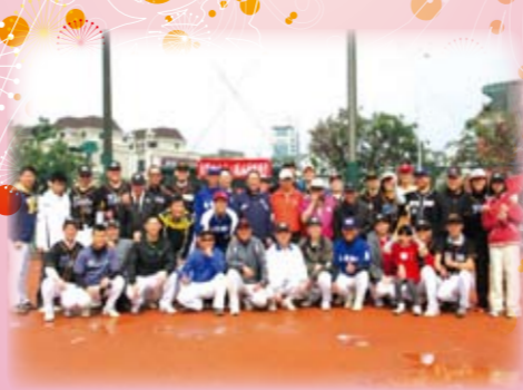
本校教職員壘球隊與交通大學EMBA壘球隊合影