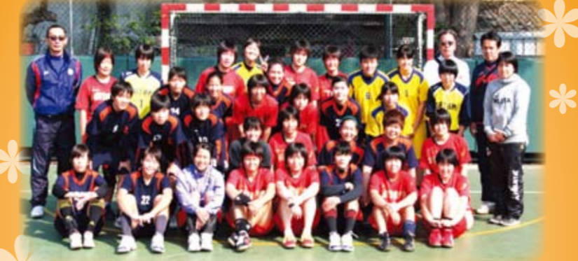
與日本埼玉縣高中女子手球隊合影

本次交流比賽，本校男子隊以參加全國賽一、二年級之選手所組成，終場以33：20擊敗男子聯隊；在女子隊方面，雖身材體型略遜一籌，亦以優異成績戰勝客隊。