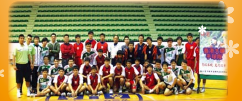
與香港大學男子手球隊合影

香港大學男、女手球隊於100年12月27日至28日計2天，二度至本校進行移地訓練。該校為參加2012年1月「香港大專手球錦標賽」，來校進行賽前練習。本次交流比賽，除增加球員實戰經驗外，亦提昇兩校之友誼。