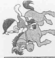
←團體馬術賽中華馬術隊奪得銅牌。