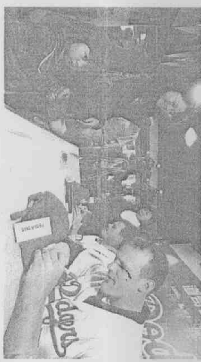
道奇隊投手史道斯(右一)和內野手卡洛(右二)出席球送簽名會，現場氣氛熱烈。

【記者吳清正／台北報導】道奇隊訪台首戰的先發投手史道斯，昨天和隊友卡洛一起出席本隊來台唯一由大聯盟主辦的簽名會，原本限量一百名球迷，現場推擠連兩、三小時，兩小時內為承辦的創信公司帶來約二十萬元的業績。 昨天上午九時開始的簽名會，凌晨起就有球迷提早排隊，上午七時已有不少人聚集，由於球迷必須先購買一件道奇台灣賽限量商品才能排隊簽名，雖然到場球迷遠超過原本的名額限制，最後所有排隊球迷都獲得簽名，為創信公司帶來超乎預期的買氣。 卡洛為了這場簽名會，事先還惡補中文簽名，雖然昨天還是用英文簽名，但是希望下次有機會展現自己的中文簽名。 史道斯和卡洛表示，這兩天深刻感受到台灣球迷的熱情，親眼見證台灣有這麼多球迷支持他們，覺得這一次台灣行真的很有價值。