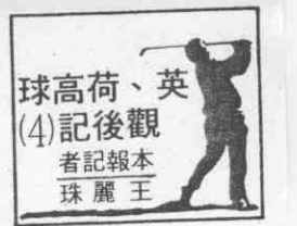
英、荷高球賽，(4)後觀者記報本 珠麗王

●荷蘭高球公開賽冠上KLM(荷航)的名字已有十年之久。歐洲高球巡迴賽自兩年前起改稱為Volvo Tour，因為富豪汽車公司每年贊助五百萬英鎊，並簽下五年贊助合約。世界杯高球賽自三年前起，全名更改為Philip Morris World Cup，摩里斯公司的字體，比世界杯還大，只因為該公司是世界杯的最大贊助人。職業運動在世界各地日漸蓬勃，完全就是因為與企業界充份結合。