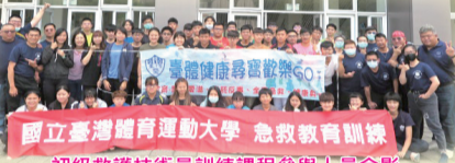
初級救護技術員訓練課程參與人員合影