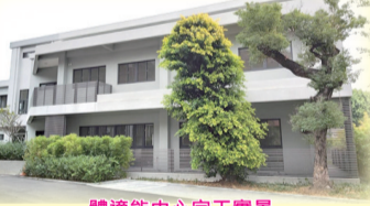
體適能中心完工實景