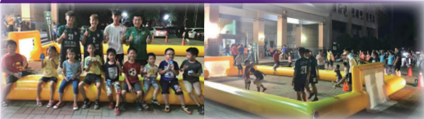
參與南投縣「運動臺灣~運動夜市」