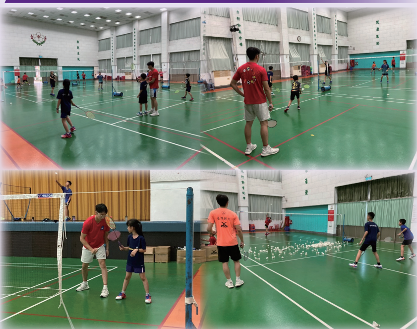
臺中教育大學附設實驗國民小學（簡稱臺中實小、中教大附小）指導