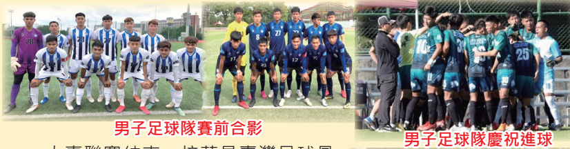
男子足球隊賽前合影

109學年度大專足球聯賽男子足球隊如期順利進入四強賽，在重要的賽事之前，也面臨到有可能會掉出四強外的危機。教練賽前多次提醒選手，我們是傳統球隊，以往大專聯賽最差也是在前四強，希望球隊秉持體大的駱駝精神，不輕言放棄，最終兩場的複賽順利拿下，挺進四強，達成預期目標。在四強交叉賽面對輔仁大學，在賽事中選手士氣高昂的拚戰到最後，也一路領先到最後一刻，但天不從人願，在最後2分鐘被對方逼平，賽事也進入了延長賽、最後PK大戰，雖然結果不如預期，但團隊那種不放棄的精神，是值得讚賞的，本次賽事獲得了殿軍，繼去年是同等成績，不過感受到學生的蛻變，也期望明年一定要把冠軍帶回學校，讓臺灣體大男子足球隊重返榮耀。