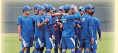
109年大專盃賽前練習

經過這次比賽大家都茁壯了許多，但大家應該也知道自己是最大的敵人，自己的能力還需要再更精進，才能超越別人，我想大家每次的目標一定只有一個！希望各位繼續為明年的大專盃加油，因為我們是：「臺灣體大棒球隊」！