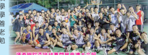
運產學院盃籃球賽開幕典禮大合照