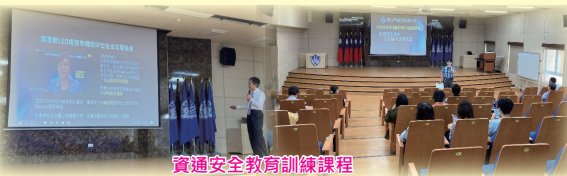
資通安全教育訓練課程