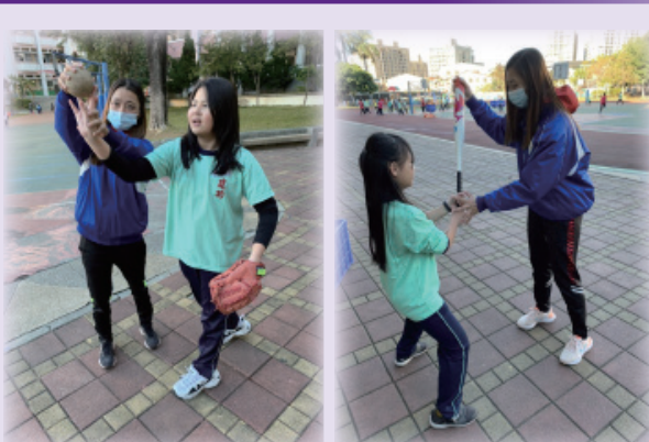
臺中市建功國小指導學習