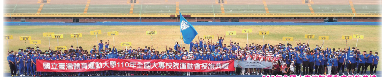
110年全國大專校院運動會授旗典禮

110年全國大專校院運動會（大運會）自5月6日起於國立成功大學開場，本校共派出師生選手530人，其中選手418人，隊職員60人，運動防護員35人及攝影隊17人，參與19個運動競賽項目。19個競賽項目中射擊比賽於5月6日在桃園公西靶場展開，接著是桌球與橄欖球項目於5月7日在成大展開，隨後則是擊劍與跆拳道於5月8日，其餘項目則在5月12日後陸續登場。本校今年以銀而不捨、再造巔峰為目標，期待再次攻頂拿下總冠軍榮譽，因此在全校師生的努力下，從大會一開始本校即在獎牌數上一路領先。但因新冠肺炎疫情的關係，主辦單位於5月15日宣布比賽中止。截至賽事中止前，本校選手完成射擊、游泳、桌球、擊劍、跆拳道、拳擊、射箭公開組等項目，共獲得29金、18銀、21銅佳績。其中游泳17金、11銀、8銅；拳擊4金、2銀、2銅；擊劍3金、2銀、2銅；桌球3金、1銅；跆拳道2金、2銀、6銅；射箭公開組1銀、2銅。