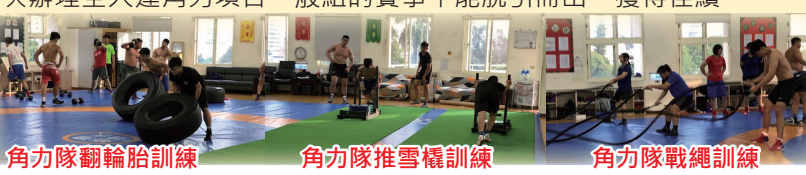
角力隊翻輪胎訓練

在今年大大運角力項目中增加了一般組，由男生組希臘式、男生組自由式、女生組自由式各增列四個量級，共有12面金牌。亦將這樣的好消息向同學們進行大力的宣傳，並在術科上課期間，不斷地宣傳角力一般組的比賽項目，在這樣有力度地宣傳下，共有七位同學願意參加這次的比賽。這些參賽的同學們更加利用下午專長課期間，自發性地前來一起接受訓練，教練也利用晚上的時間加強一般組的訓練，在齊心協力維持快狠準的訓練模式下，期望七位一般組同學們在第一次辦理大大運角力項目一般組的賽事中能脫穎而出，獲得佳績。