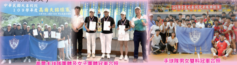
高爾夫球隊團體及女子團體冠軍合照 手球隊男女雙料冠軍合照