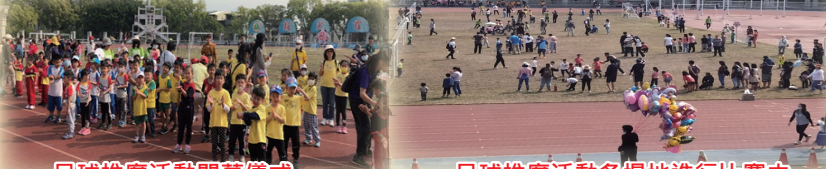
足球推廣活動開幕儀式

除了競賽之外，男足隊也利用沒有賽事的時間持續進行推廣基層足球的各項活動，辦理賽事活動、種子教師足球研習與足球趣味競賽等活動，畢竟足球幼苗是現在及未來的主人翁，能夠讓足球普及化就是要從小做起，扎根，更何況面臨少子化的狀況，更是要積極的推廣，一方面增進種子教師對足球運動項目的認知及了解，一方面讓更多人來參與足球，使得足球人口普及化，當然也是希望能有個完整的體系，如鄉鎮市的國小端、國中端、高中端，從參與-喜歡-基礎-專業-更專業，也能夠持續到大學端，善用本校專業人才，協助偏鄉地區培育足球人口，成為有效資產，以利未來銜接進入本校就讀，增加專長學生就業機會，形成良性循環。