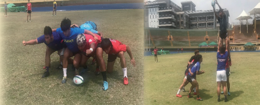
橄欖球隊正集團練習