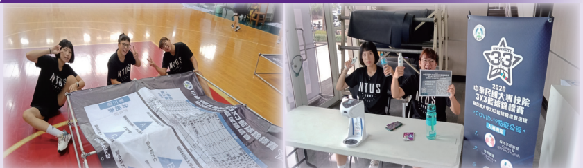
協助大專體總籃球賽事並擔任紀錄台、場地管理、裁判等相關工作