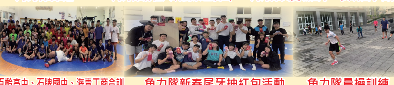
百餘高中、石碇國中、海青工商合訓