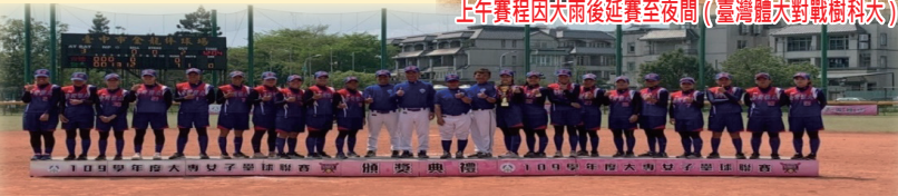
女壘隊獲得大專院女子壘球聯賽亞軍團體照

冠軍戰對戰隊手為暨南大學，暨南大學選手多為2022年杭州亞運培訓隊班底，預賽的兩個循環的皆以小比數落敗，進入到三戰兩勝冠亞軍戰因投手無法壓制暨南大學的攻擊火力，以兩敗拿下第二名。改制為大專院女子壘球聯賽，前二名皆符合教育部體育署初級專任運動教練資格，本校20名選手皆在本次比賽取得資格。