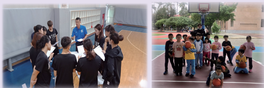
MAC 品格籃球教學團隊教學指導