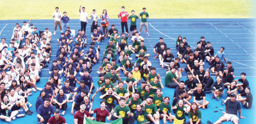
「沒明星運動會」系會活動全體師生合影