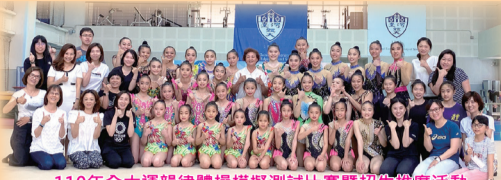
110年全中大運韻律體操模擬測試比賽暨招生推廣活動