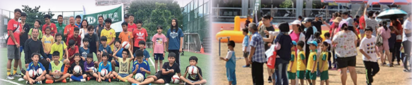
負責109南投縣運動會足球比賽裁判工作