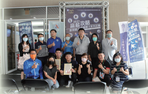
校內師長、行政院中部聯合服務中心、勞動部與企業代表於開幕儀式合影

今年徵才系列活動為期一周，每天邀請公部門與企業廠商設攤徵才，共計29家參與現場面試，立即媒合，並安排專家為學生提供履歷健診服務，職缺則以運動教育、藝術、體育相關人才為主，活動參與人數達566人次，圓滿成功。