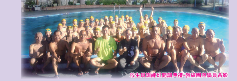
救生員訓練班開訓典禮-教練團與學員合影