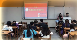
女排隊討論築夢踏實計畫

築夢踏實計畫目前到一個段落後，又接著舉辦了中國小排球交流賽，女孩們分別擔任裁判、教練、以及工作人員的角色，身兼多職是為了磨練女孩們的韌性，並學習擔任教練時如何在短暫的暫停中給予球員及時有效的戰術指導，或許只需要一場比賽就會疲憊無比，但女孩們並沒有因此偷懶退縮，而是更加努力地去做完自己份內工作，不懂的地方也會自己私下找時間和教練討論，化解自己不足的地方改進精進自己的能力，未來女孩們能需再加油努力與學習更多不一樣的東西。