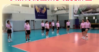
女排隊籌備築夢踏實計畫課程