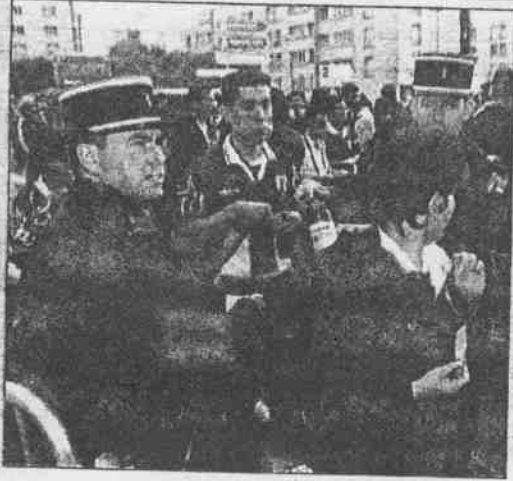
本屆世足賽入場檢查很嚴，二十一世紀不必這麼麻煩，每位球迷身上裝的電子晶片可以使他們的一舉一動無所遁形。

球場四條邊線也裝了測量儀，專門測量是否有越位，而主控台就由場邊助理裁判來操控。當然，球員就必須裝上一個電子卡，這張卡片發出的訊號是供測量儀判定越位與否用的。