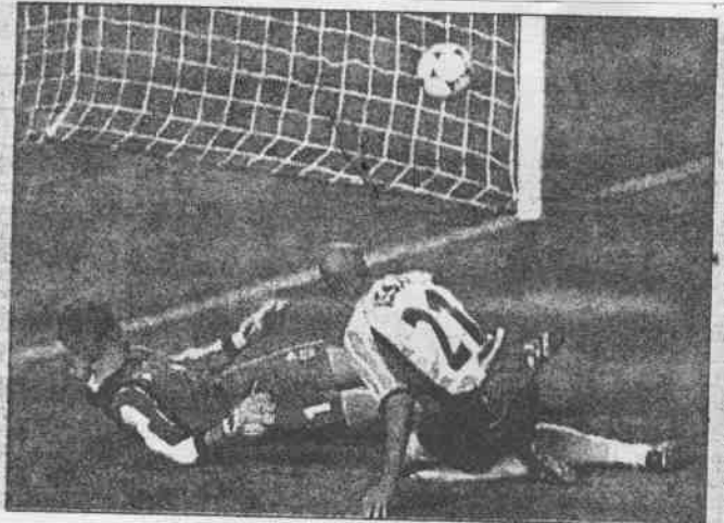
這一球進了沒？二十一世紀裝在球門邊的雷射偵測儀會清楚判斷。