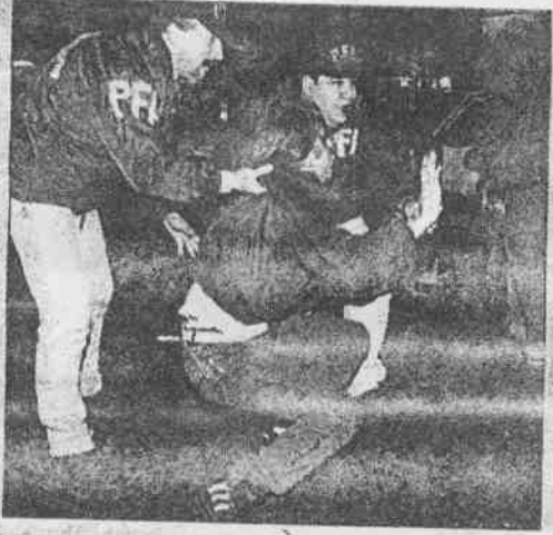
足球流氓頭痛了，因為對付他們的將是機器戰警。