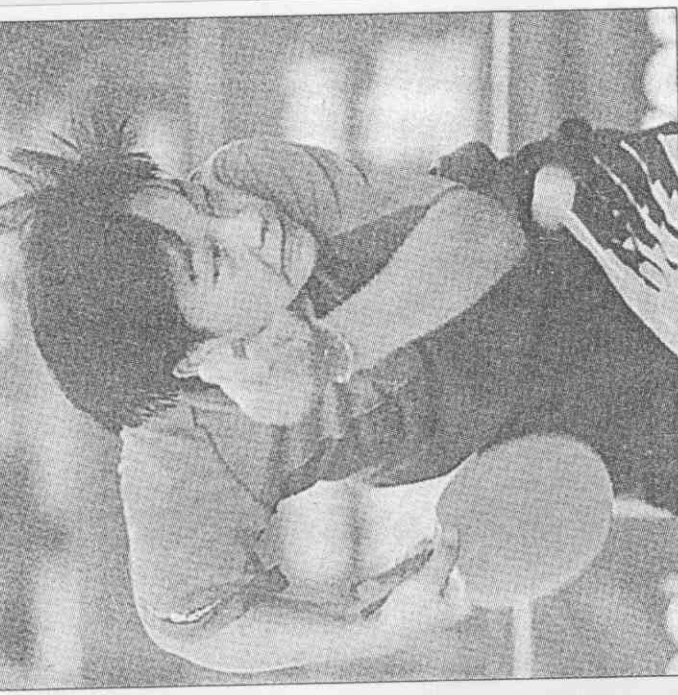
◆中華選手游鳳芸，昨天和崔秀里在亞洲桌球賽打進前四強。資料照片 記者黃育仁／攝影 ◆中華女桌名將崔秀里，昨天在亞洲桌球賽單打擊敗香港的齊寶華，雙打晉級前四。資料照片 記者邱勤庭／攝影