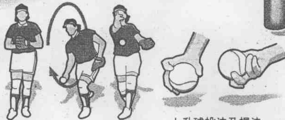
上升球投法及握法

●女壘投手投球，與棒球完全不同，棒球投手高肩、側肩、低肩投法均可，沒有限制，女壘投手投球時