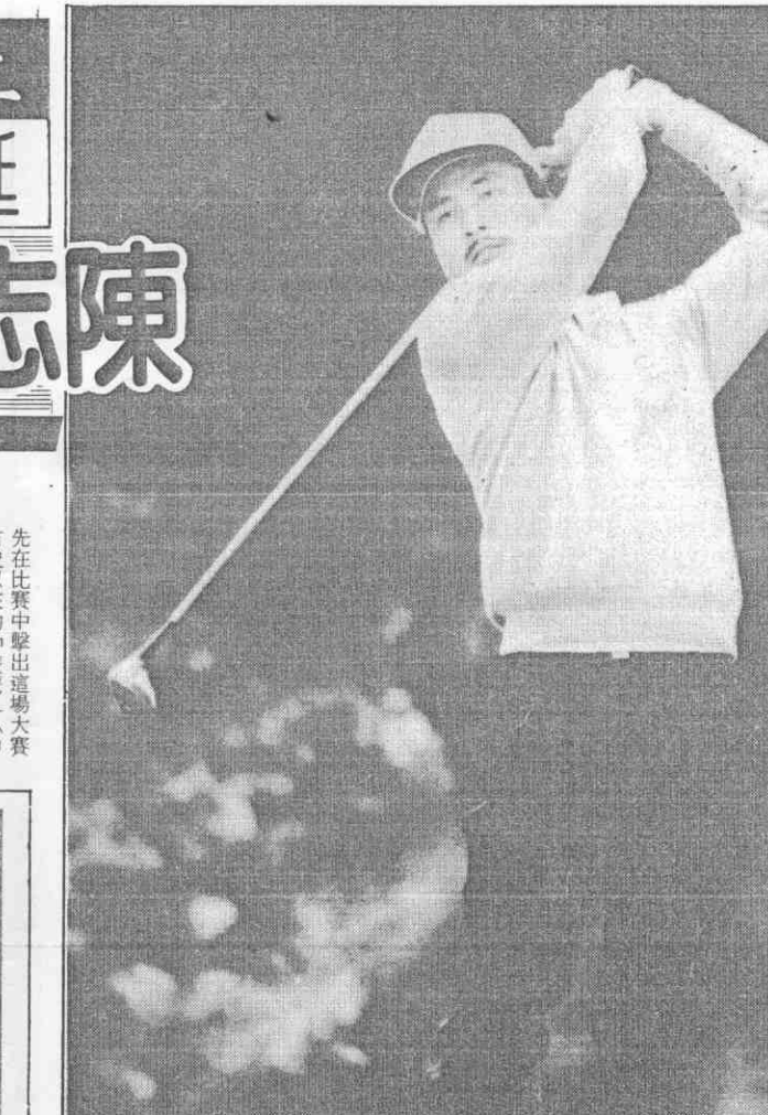
開洞七第在他為圖，軍冠賽開公夫爾高磯杉洛得贏忠志陳利勝次首來以賽巡巡夫爾高國美加參忠志陳是這，情神的球。銜榮軍冠得奪中賽巡巡國美在次首手選國民華中是也。