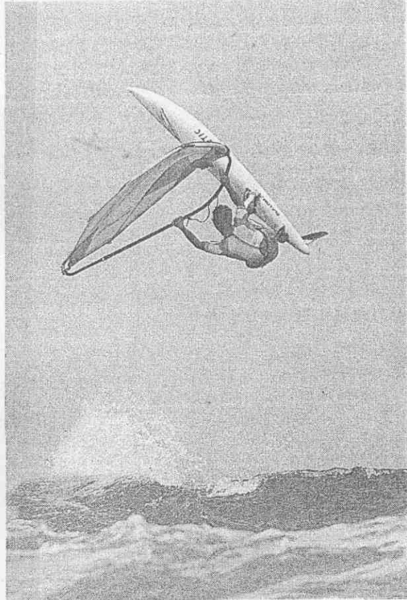
↑呂源榮躍空技術了得。