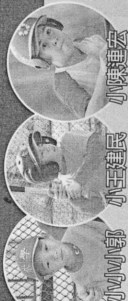
小小郭 小小王建民 小小陳建宏