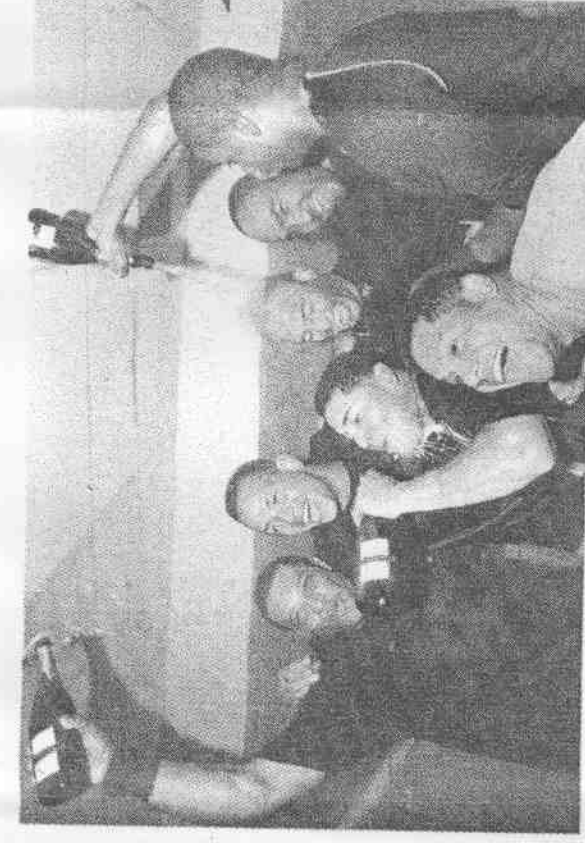
洋基拿下季後賽門票，用腦袋喝香檳成了昨天洋基休息室裡最常見到的畫面。 (特派記者廖振輝攝)