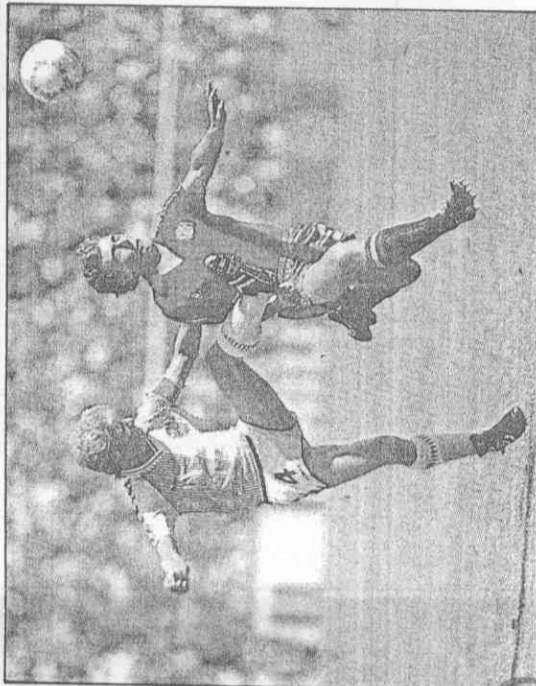
布拉克諾(右)是西班牙在世界杯擊敗強敵丹麥的入球英雄。