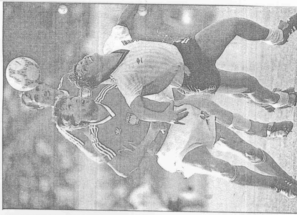
▲英格蘭行情看好，萊克(右)仍是入球倚賴者。

歐洲八強將在六月會集西德足下見真章，是今年漢城奧運會之前，一九八八年最受矚目的體育大事。