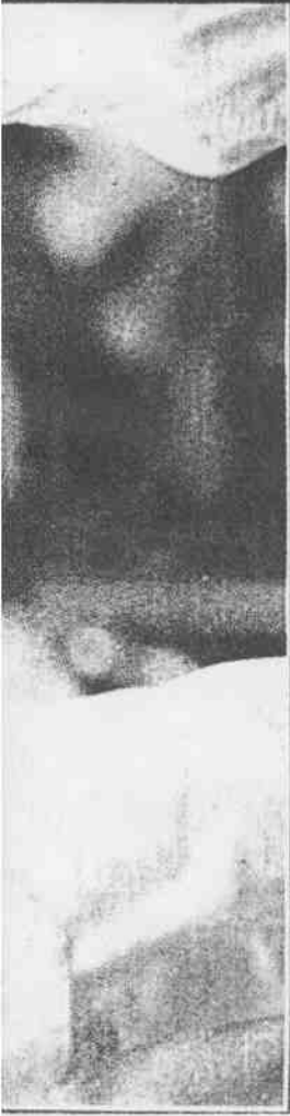
真傳谷曼／永錫洪 者記派特 。金二第道拳跆拳道隊華中下拿，手對韓南敗擊戰牌金在菱芷許 。獎銀、金受接英鋒黎手好陸大前的隊華中表代與（右）霞楊陸大級斤公三十五重舉子女 真傳谷曼／助天李 者記派特