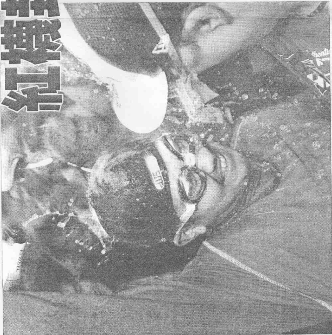
紅襪隊日本投手松坂大輔(左)昨天在第七戰拿下勝投，嘗到香檳灌頂的美妙滋味。

【記者雷光涵／綜合美國外電報導】繼3年前的血淚封王，紅襪隊再寫一章傳奇；在美聯冠軍戰3連勝逆轉，擊敗印地安人隊，後天與洛杉磯隊爭世界大賽金盃。 昨天紅襪通過一次又一次心驚膽跳的考驗。5局，拉米瑞茲強大大臂力長傳刺殺洛夫頓；7局游擊手路戈守備失誤，印地安人洛夫頓後來卻在三壘教練的指示下，沒衝本壘，最後，布雷克擊出雙殺打。 印地安人的壘壘出現裂痕。7局下半三壘手布雷克第一時間沒把艾爾斯布