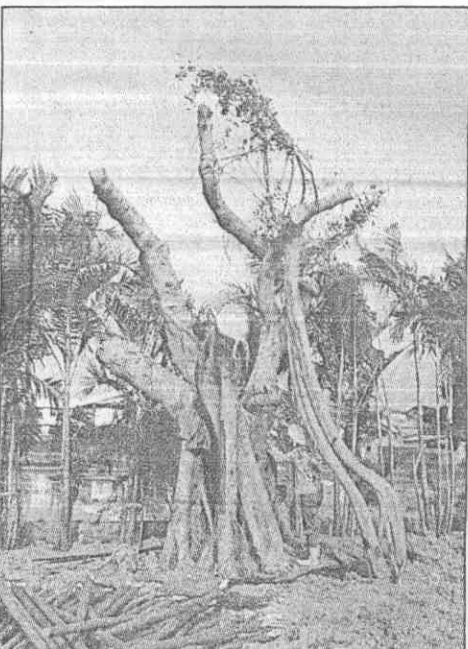
近附場球在正前目，來找省全從樹大些這 。