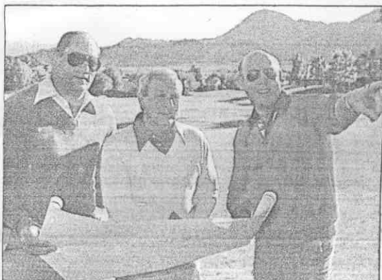
。心信具深場球的計設已自對(中)瑪帕諾阿