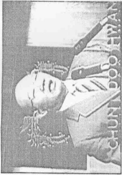
韓國大總統全斗煥宣佈第十屆亞運會正式開幕。