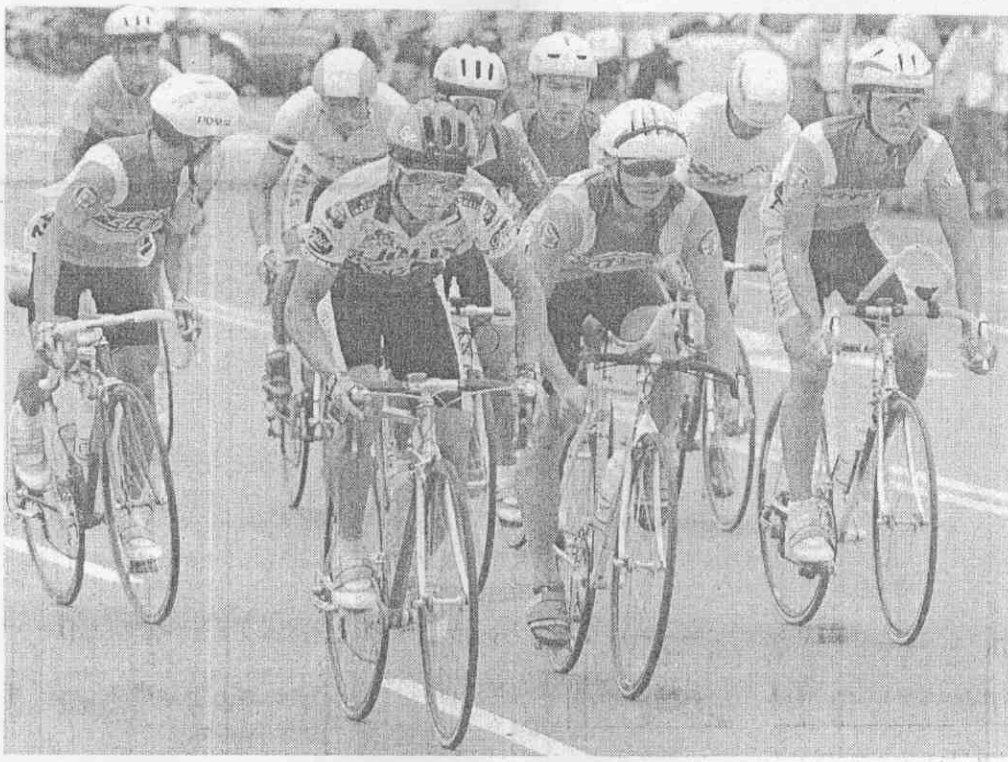
終點前六百公尺左右搶先突破重圍，拿到第一。