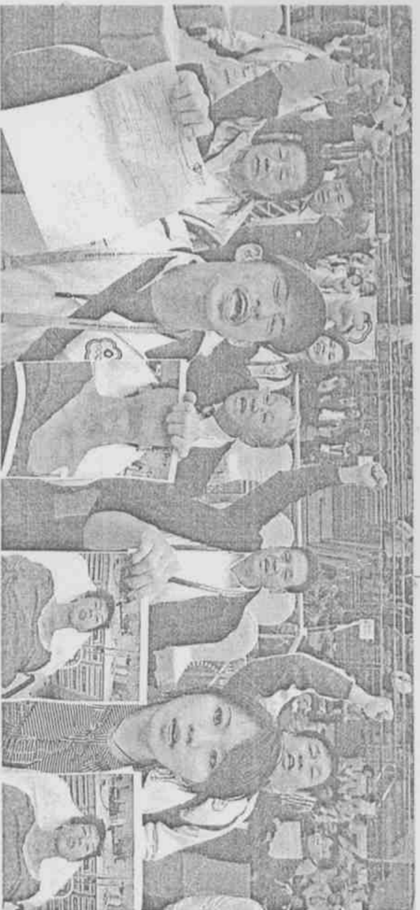
台灣去年在東亞運集體抗議行動(圖)，被認為違反只有教練與領隊有權抗議的規定。