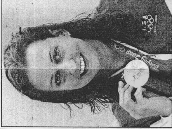
動過心臟手術的美國索妮妮昨天在女子200公尺蛙式決賽，擊敗世界紀錄保持人，在奧運摘金。