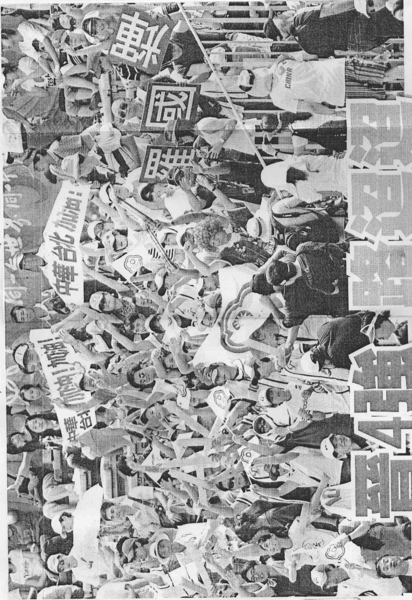
即使前天意外 敗給中國，為 台灣隊加油的 球迷熱情不減 ，高聲標語及 會旗，大聲為 台灣隊加油。