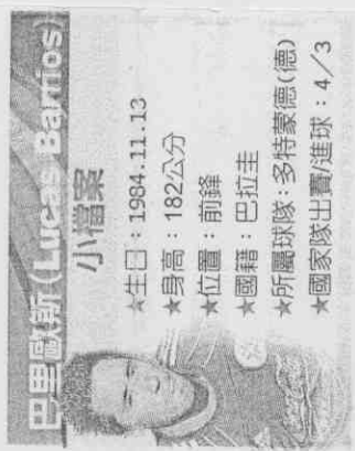
巴里歐斯(Lucas Barrios) 小檔案 ★生日：1984.11.13 ★身高：182公分 ★位置：前鋒 ★國籍：巴拉圭 ★所屬球隊：多特蒙德(德) ★國家隊出賽進球：4/3

母親是巴拉圭人，但出生於阿根廷的巴里歐斯，19歲開始嶄露頭角，6年來效力過8支球隊，足跡遍及阿根廷、智利、墨西哥與德國。生涯最輝煌的時刻在2008年智利科洛科洛隊，當年38場比賽攻進37球，