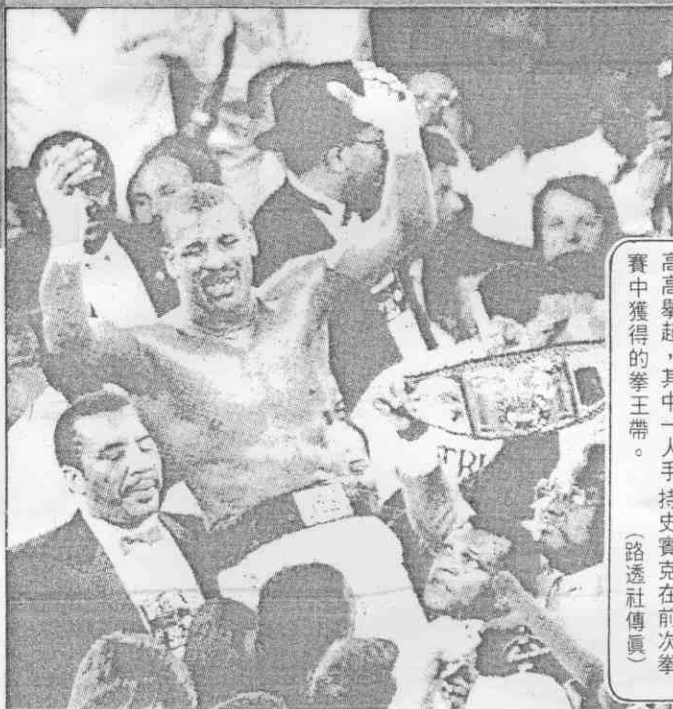
◀ 史賓克以技術擊倒打敗庫尼後，為拳迷 高高舉起，其中一人手持史賓克在前次拳 賽中獲得的拳王帶。

◀ 兩位沒有任何拳王頭銜的 重量級選手史賓克(左)與庫尼 (右)昨天對壘，史賓克在第五 回合兩度擊倒庫尼。