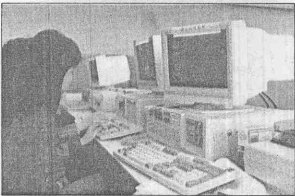
↑全面電腦化將使今年大運會作業流程更迅速。