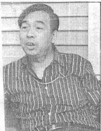
大陸女隊末打技術水準。練張燮林副無奈。 (林源明記者報導)

展開了一場打擊戰。大洋隊在第二局先馳得點，以三比零打攻下三分。巨人隊在第五局展開強烈反攻，以八比零打一舉攻下八分，奠定了勝基。大洋隊從第六局起雖然急起直追，但未能挽回敗局。