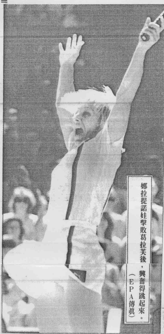
娜拉提諾娃擊敗葛拉芙後，興奮得跳起來。

一月，在紐約維吉尼亞苗條於錦標賽決賽打敗葛拉芙以來，一直到四日為止，她未曾拿過任何一次比賽冠軍。而在四日之前，葛拉芙在一九八七年內未曾當過敗績，一共連贏四十五場，包括在法國公開賽決賽中打敗娜拉提諾娃。 但這種情況在溫布頓中央球場中完全改變，由娜拉提諾娃再度取得領先地位。 娜拉提諾娃連續第六年獲得溫布頓冠軍，打破她和法國運格連以及瑞典柏格共同保持的五次紀錄。她在四日的比賽中，表現出完美的發球與截擊的草地球場技巧。