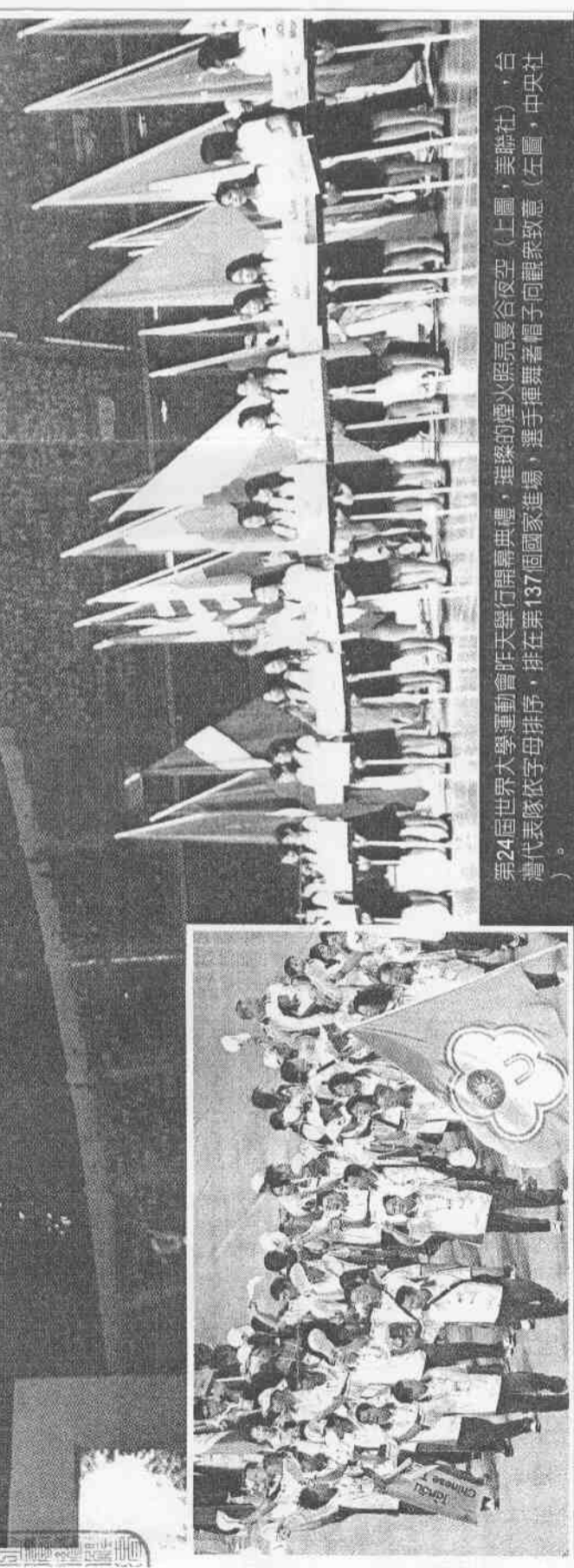
第24屆世界大學運動會昨天舉行開幕典禮，璀璨的煙火照亮曼谷夜空（上圖），台灣代表隊依字母排序，排在第137個國家進場，選手揮舞著帽子向觀眾致意（左圖）。