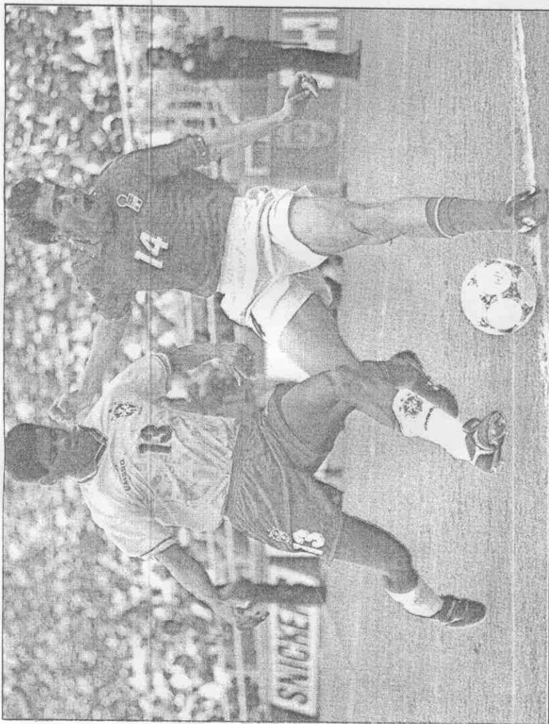
↑ 後防大將山杜士(左)在羅馬隊爭正選位置。