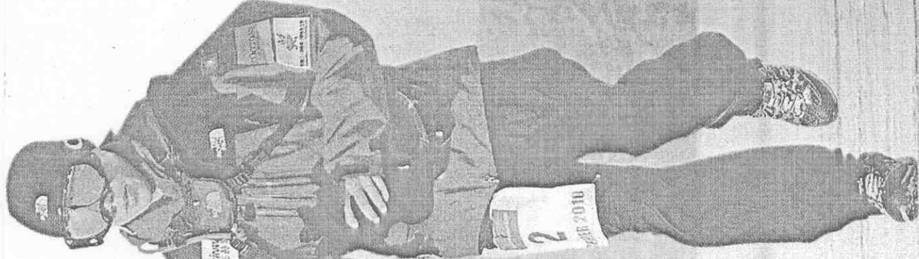
■勇闖南極的超馬鬥士陳彥博，忍受孤獨，迎著寒風跑完全程。