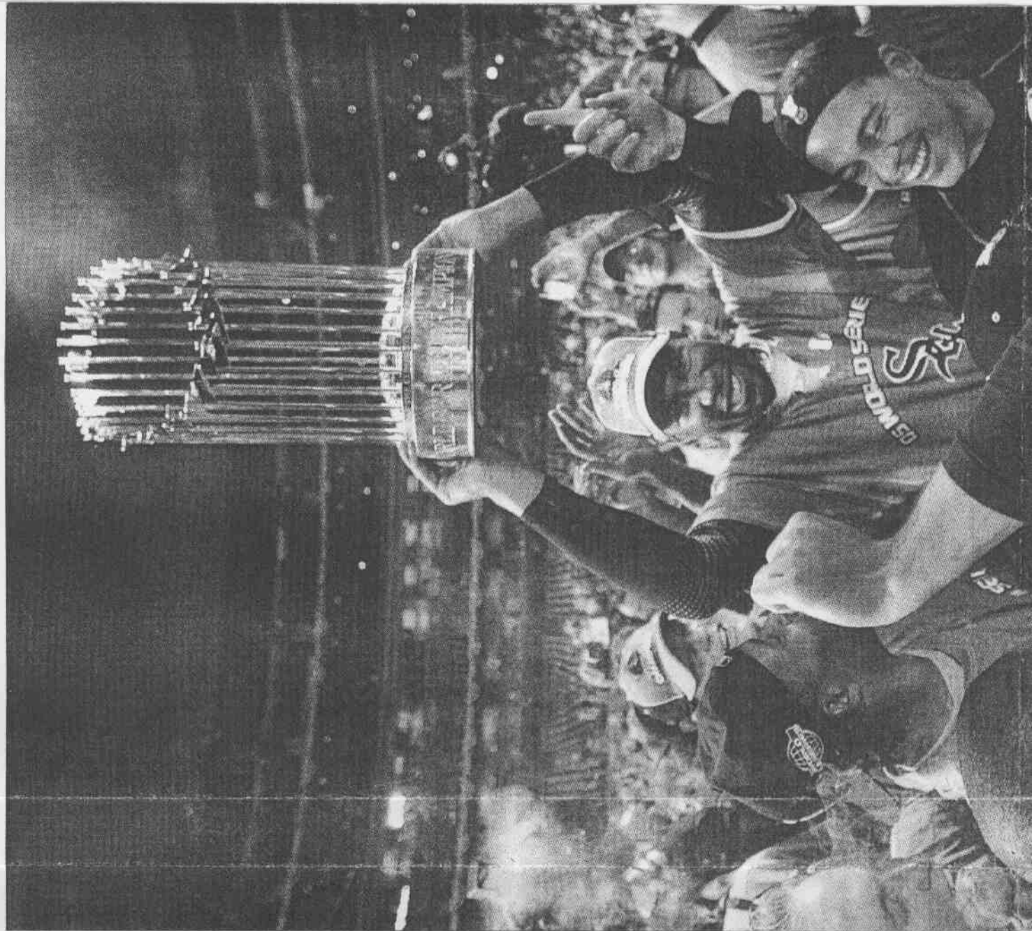
白襪隊在賽後慶祝奪冠。