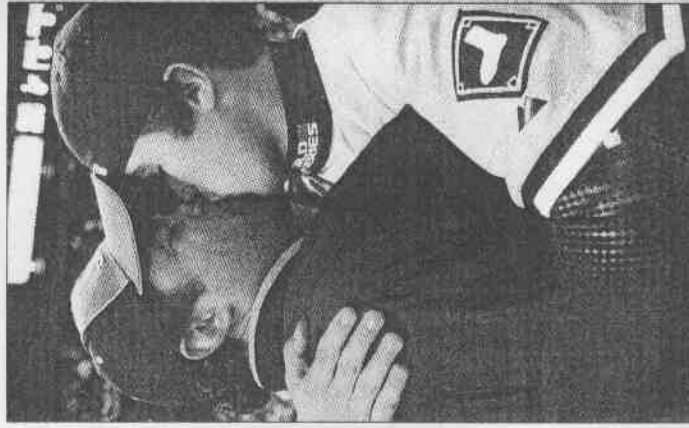
白襪隊教頭吉恩在賽後顯得有些感傷。