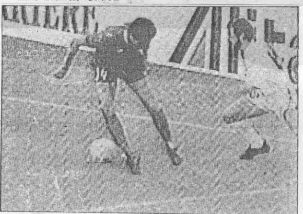
↑烏拉圭(右)與南韓球員，在端線附近爭球。