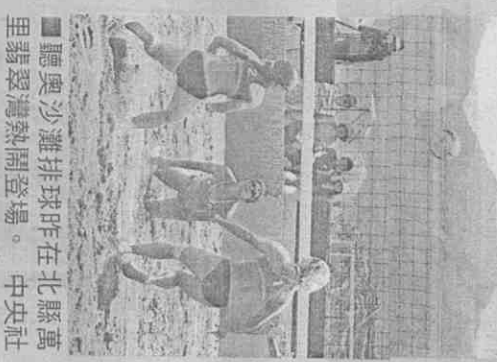
聽障奧運排球昨在北縣萬里碧翠灣熱鬧登場。