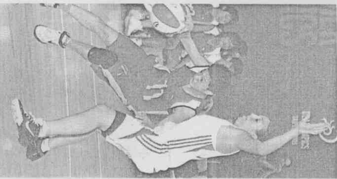
中國女籃隊昨對希臘吞敗。