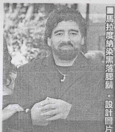
■馬拉度納染黑落腮鬚。設計圖片