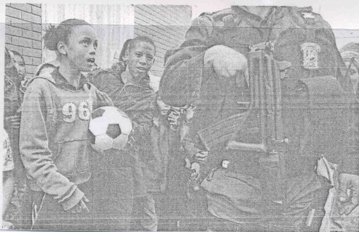
■南非政府特別警告各隊，就算在旅館也不能掉以輕心。

雖然南非在世界盃期間部署19萬警力跟4萬4000軍力，但中國、葡萄牙和西班牙等國記者最近都被搶，中國政府也正式向南非當局提出保護中國公民人身安全的要求，南非政府回應，他們將對公開場合的暴力行為採取零容忍政策。