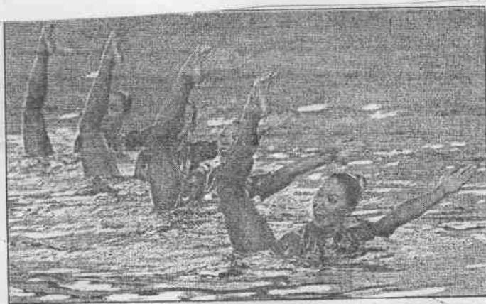
◆◆水上芭蕾加拿大隊獲得銀牌。