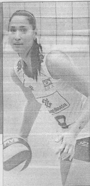
巴西隊賈桂琳吸引許多球迷目光。