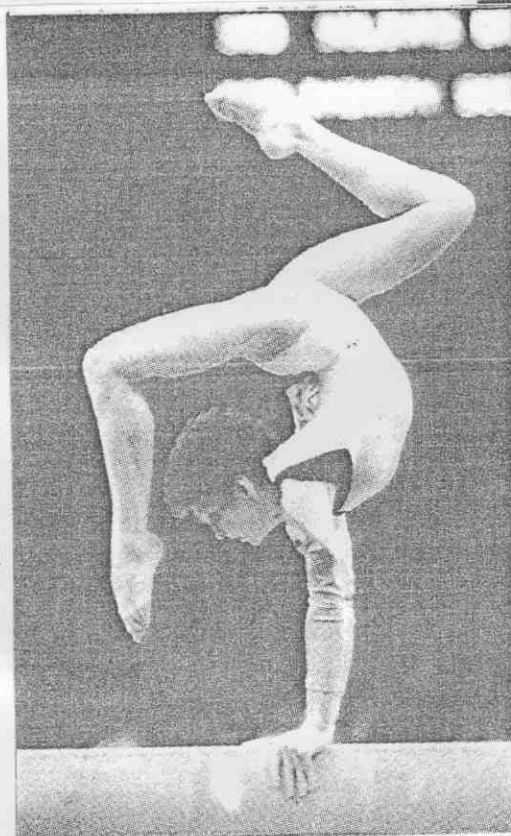
↑羅馬尼亞的瓦里西，在地板運動中，躍向（圖左）優美動作（圖上）中空，兩項均為她贏得金牌。