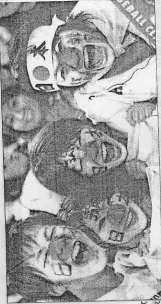
日本隊第四度對決宿敵南韓隊拿下勝利，臉上彩繪日本國旗的球迷笑開懷。

巨砲打者，我知道的是卡布雷拉、歐多尼茲。」，「這些都是好選手，我們的球員要盡最大努力緊咬不放。」 南韓是去年北京奧運棒球賽金牌隊，本屆經典賽打了7場，5勝2敗，連同3年前首屆經典賽，合計11勝3敗。 對手委內瑞拉上屆首輪即遭淘汰，近7年與南韓交手兩次，2007年在台灣洲際杯南韓9：2獲勝，2007年在台灣的世界杯，南韓再以4：0獲勝，但那兩次都沒有這次的大批大聯盟級球員加入委內瑞拉。 相關新聞見A3