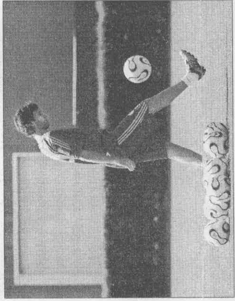
▲西班牙球星勞爾昨天在德國一個小鎮練球，今夜西班牙出戰烏克蘭。（美聯社）