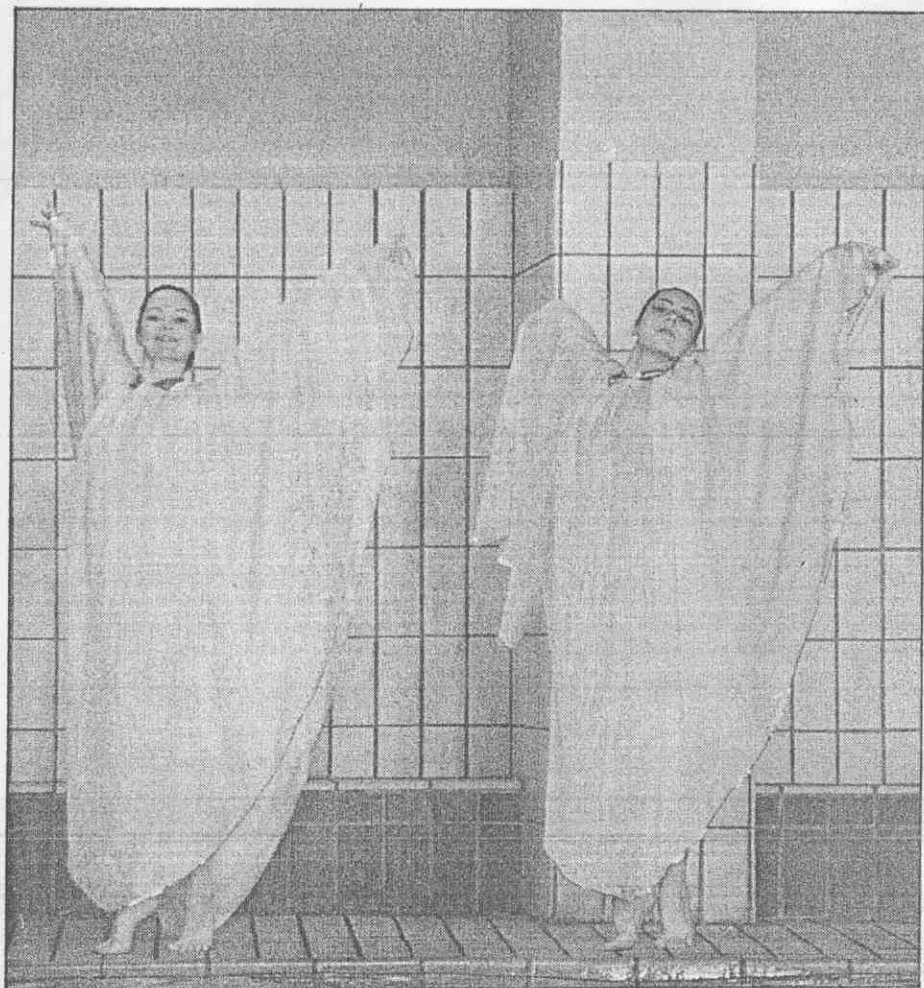
↑體操選手揉合芭蕾、地板動作帶到職業表演場，蘇聯的體育呈現多樣化。 →素負盛名的莫斯科馬戲團加入了高難度的花式體操表演，達到照顧運動員的目的。